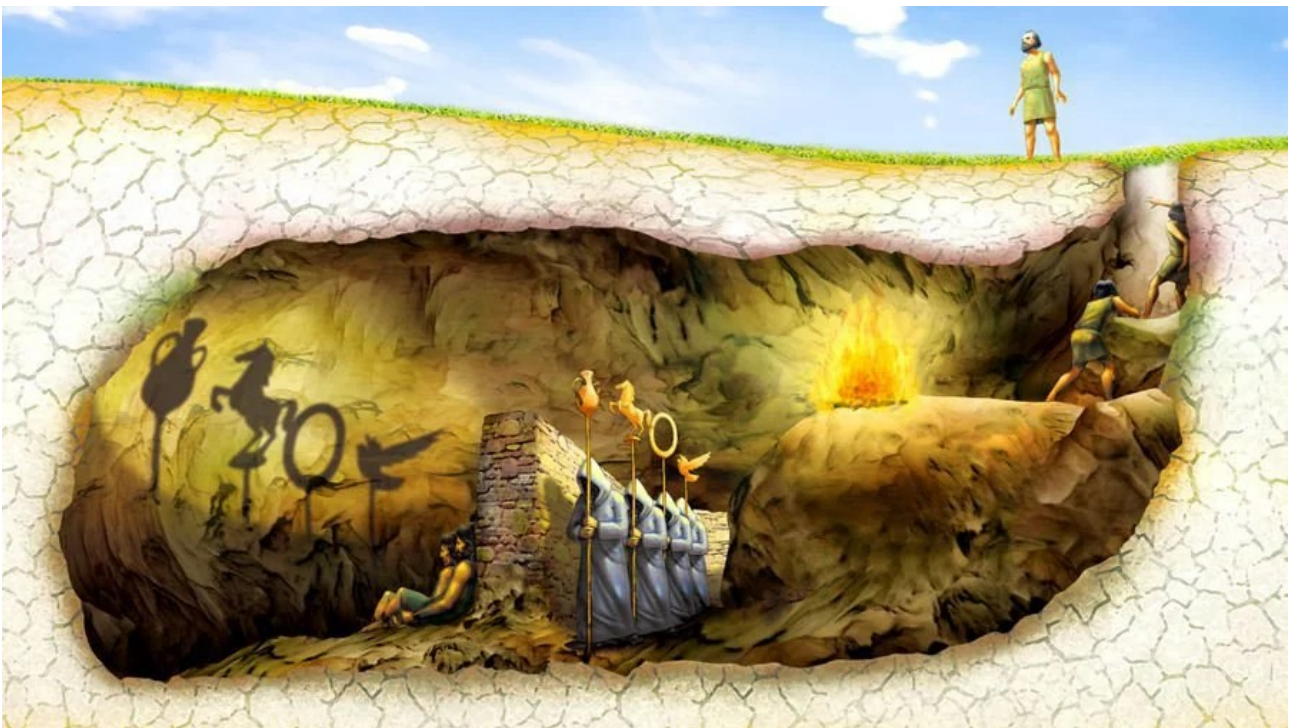
Plato's Cave

Die digitale Simulation der Realität durch Computer hat heute einen hohen Grad an Perfektion erreicht. Zum besseren Verständnis erinnern wir uns an das Höhlengleichnis von Platon :